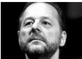
Jean-Pierre Furlan : Ténor

Elle est considérée comme l'une des meilleures sopranos actuelles. La combinaison de son timbre de voix magnifique et de l'intensité dramatique de son jeu de scène fait d'elle une très grande interprète de l'opéra Italien.